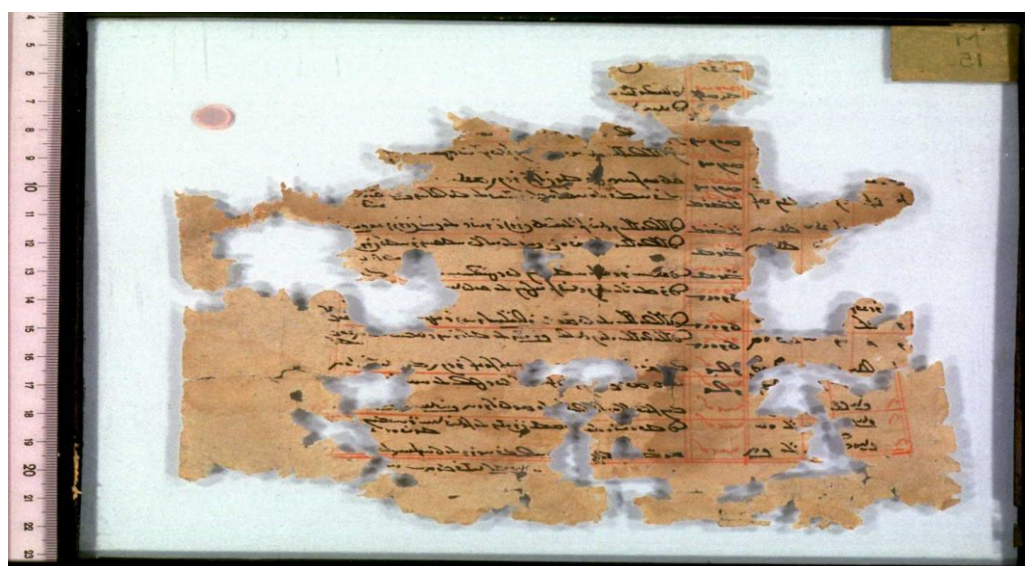
شکل ۲. متن پشت دست نویسه M150