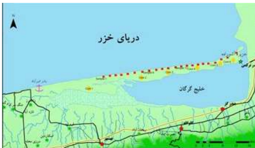
شکل ۱- جغرافیای گویش مورد مطالعه (بخش ساحلی میانکاله)

برخی نواحی کشور عراق دانسته است؛ اما باید گفت که طایفه عبدالملکی هورامی‌زبان در خارج از مناطق نامبرده سکونت دارد. محل جغرافیایی این گویش در شکل (۱) نشان داده شده است.